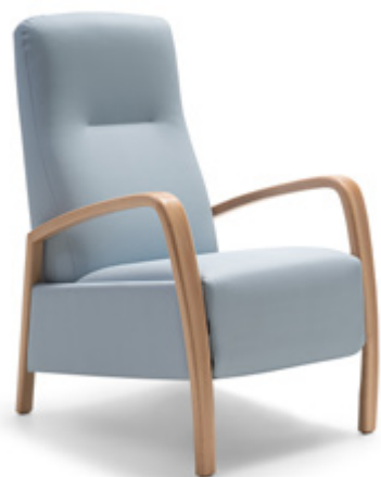
Versión fijo Fauteuil Fixe Fixed armchair