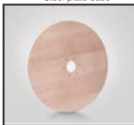
Plato Madera Pied rond en bois Beech plate base