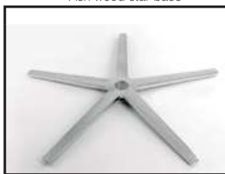
Aspas brillo Pied étoile chromé Chromed star base