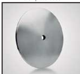
Plato acero Pied rond en Acier Steel plate base