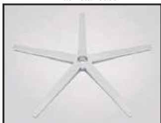
Aspas mate Pied étoile mat Matt star base