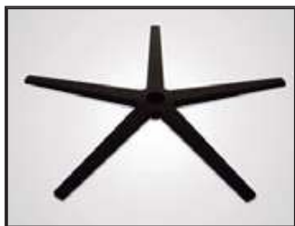
Aspas negro Pied étoile noir Black star base