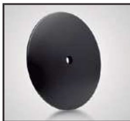
Plato negro Pied rond Noir Black plate base