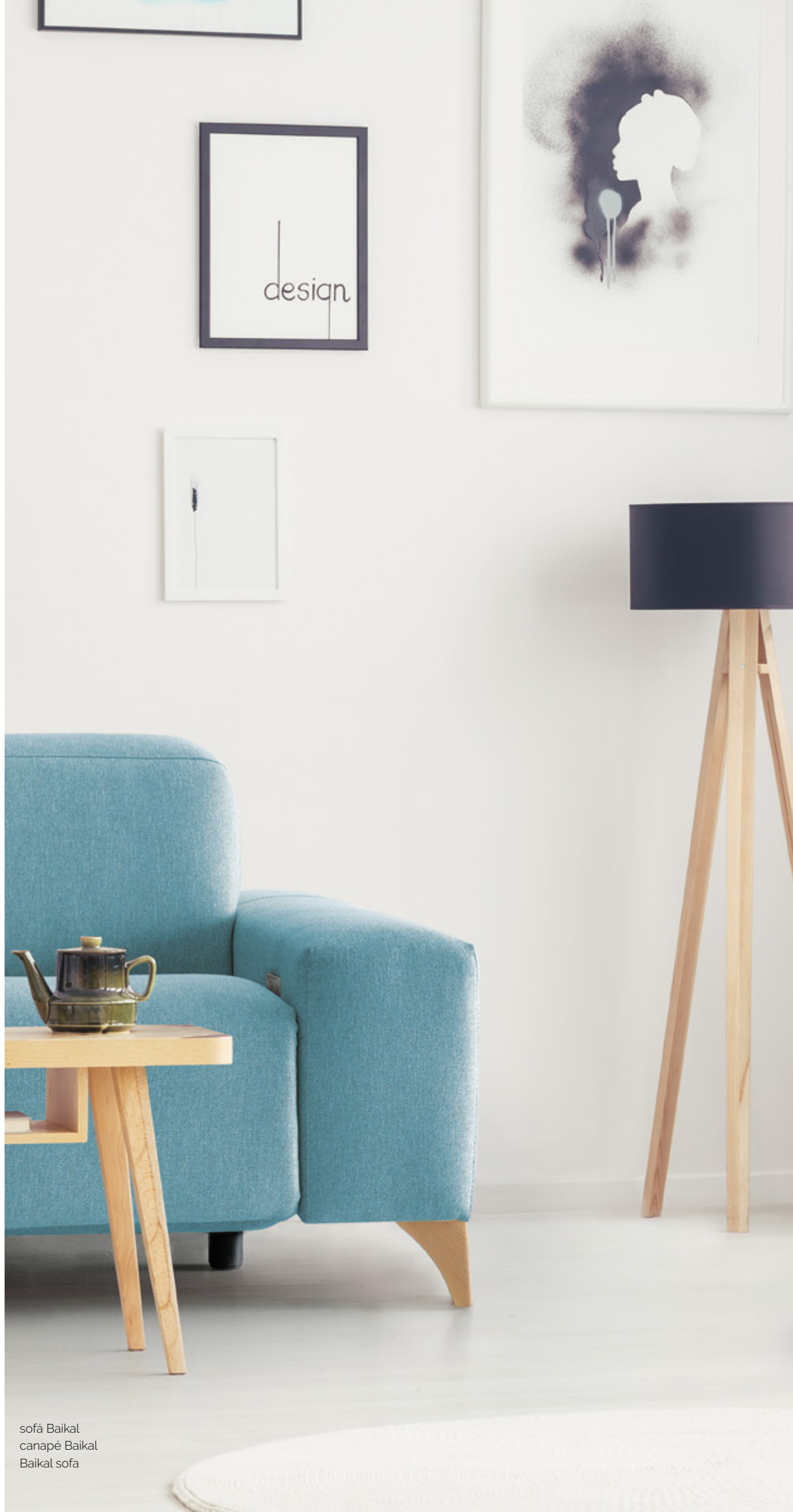
sofá Baikal canapé Baikal Baikal sofa

This is why Capri is the perfect armchair for any person regardless of his height.