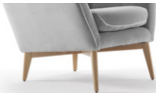
Patas de madera Pieds en bois Wooden legs