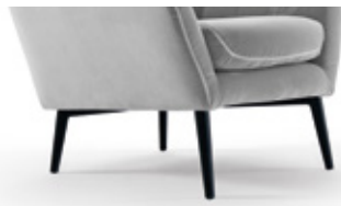
Patas metálicas en negro Pieds noir métalliques Black metallic legs