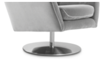
Plato giratorio Pied rond Plate base