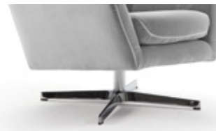
Pie giratorio aspas Pied étoile Cross base