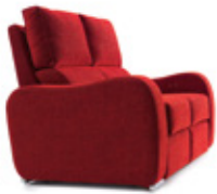
Módulo/module 60 cm