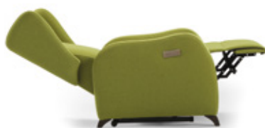
Movimiento independiente de respaldo y reposapiernas / Mouvement indépendant de dossier et repose-jambes / Independent backrest and legrest motion