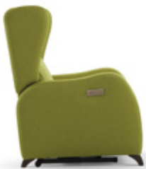
Cerrado / Fermé / Closed

*In 1 motor systems, once raised the legrest, the backrest starts to recline.