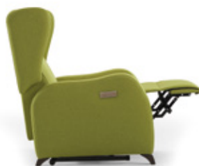
Reposapiernas elevado / Repose-jambes élevé / Raised legrest