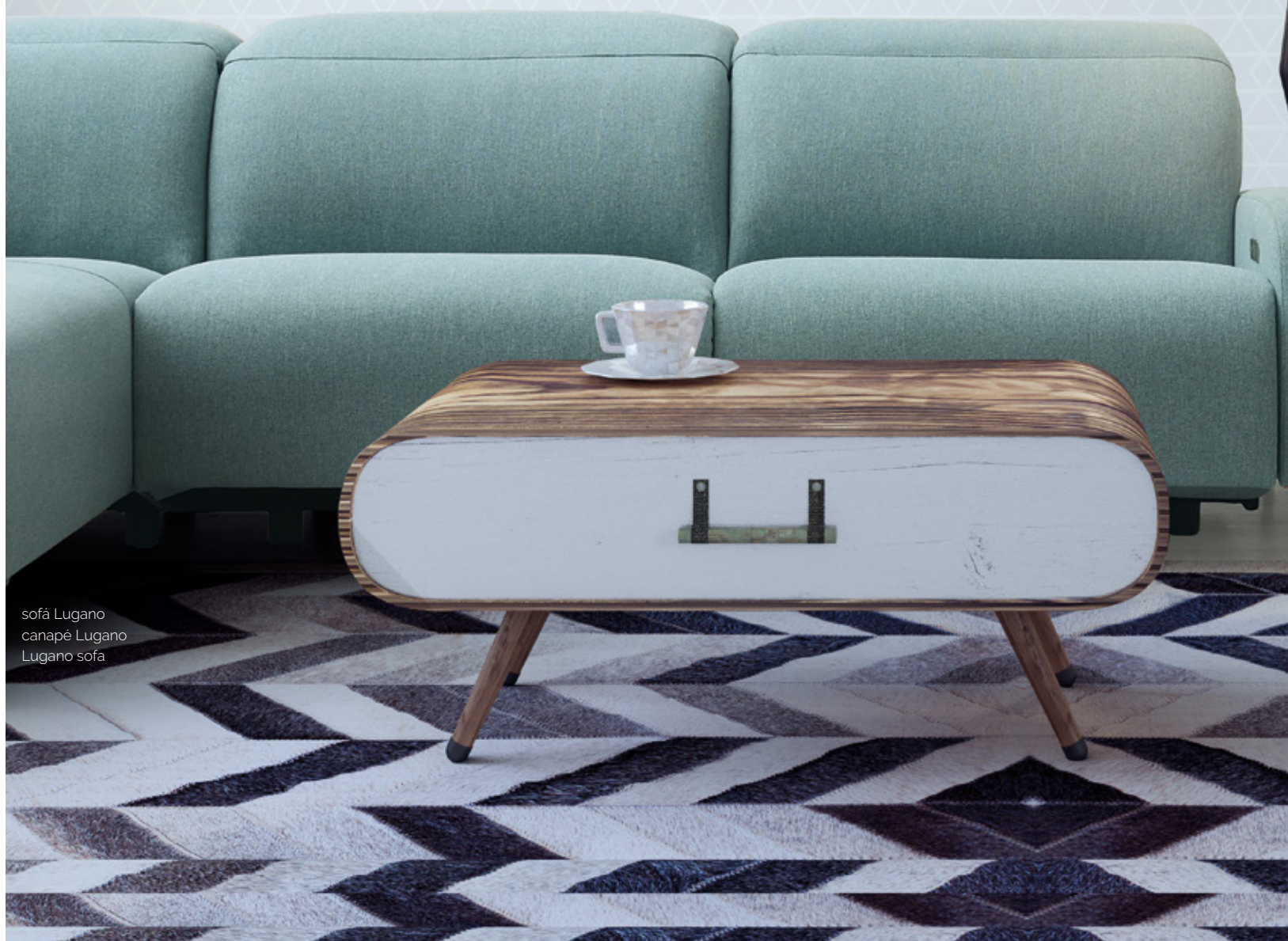
sofá Lugano canapé Lugano Lugano sofa

The Lift system with 2 motors, which may incorporate the Derby, is a mechanism able to do an independent backrest motion with respect to the legrest and vice versa. It is equipped, at the same time, with a system which make easier the lifting of people.