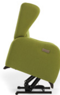
Elevado / Élevé / Stand up